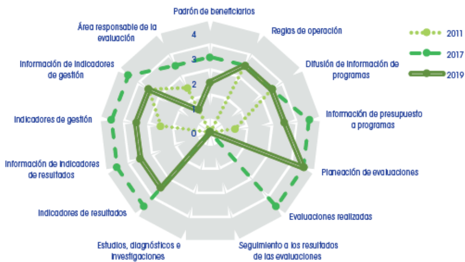
Gráfica 3. Cambio en el componente práctico, Sinaloa, 2011, 2017 y 2019