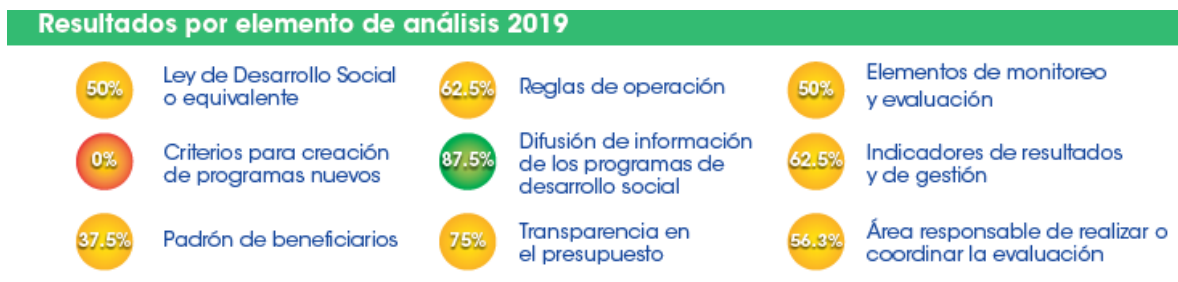
Figura 6. Principales elementos del análisis en Sinaloa en el Diagnóstico del Avance en Monitoreo y Evaluación en las Entidades Federativas 2019.

Sinaloa está clasificado como una entidad con avance bajo en la generación de elementos de monitoreo y evaluación. A continuación, se presentan sus resultados principales: